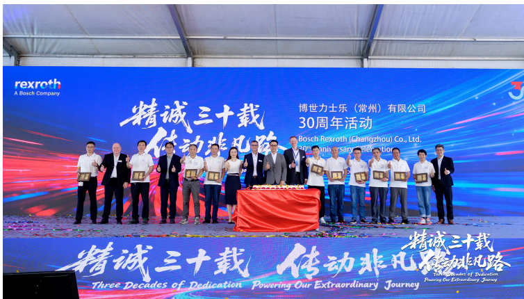
礼赞奉献者，薪火永相传 博世力士乐管理层代表向工厂30年资深员工颁发“长期服务奖”

随着博世力士乐常州工厂本地化进程的不断深入，以本地用户需求为导向的产品家族日益壮大。这些凝聚着本地研发与制造智慧结晶的产品，不仅赢得了越来越多国内用户的青睐，更吸引了全球市场的目光。面向未来，我们期待携手各界伙伴，创赢未来，共同铸就更加辉煌的传奇！