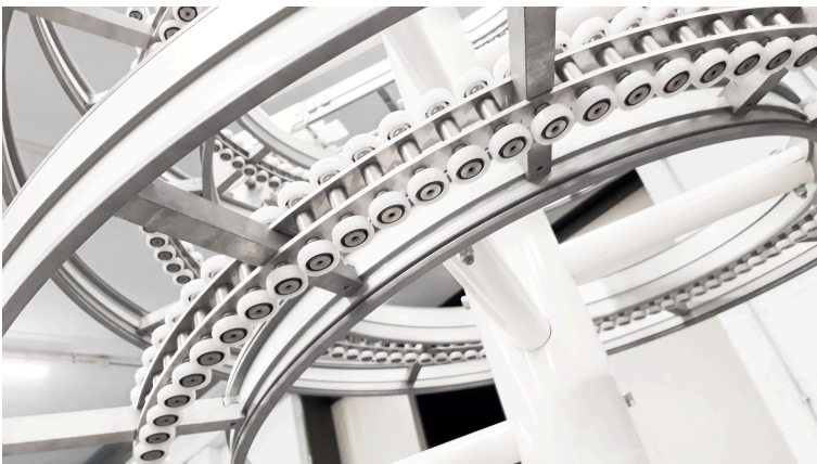
Der Spiralförderer der smartPac Srl basiert auf Komponenten des VarioFlow Baukastens und bietet so eine durchgängige Systemlösung für den platzsparenden und effizienten Transport von Gütern.