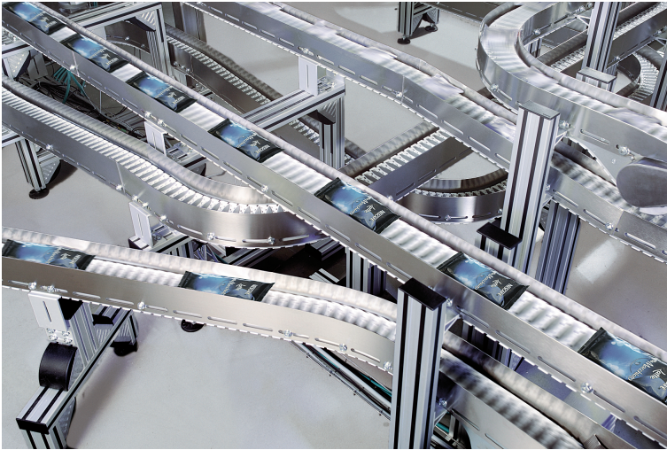
Platzsparender und kostengünstiger Transport von Konsumgütern