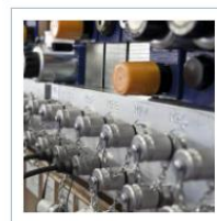
Steuerblöcke und Platten