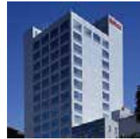
本社・東京事業所(営業本部)