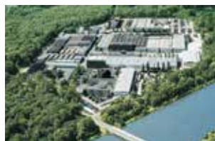
エルヒンゲン工場