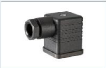
배선 상자 3P 24 M SW SPEZ R901017011