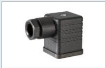
배선 상자 3P 24 M GR SPEZ. R901017010