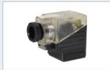
배선 상자 3P 25L M 12-240V SPEZ R901017022