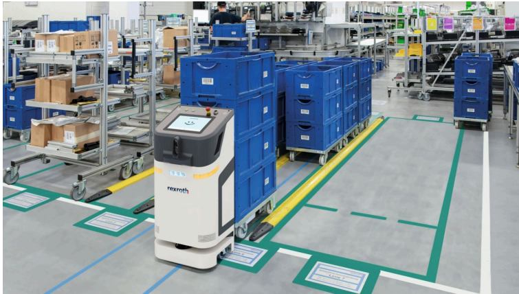
Der autonome mobile Roboter ACTIVE Shuttle transportiert Kleinladungsträger autonom, sicher und hochflexibel.