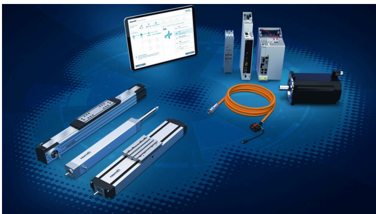
Mit einem Komplett-Paket aus abgestimmter Mechanik, Elektrik und Software können automatisierte Bewegungen jetzt ganz einfach und schnell realisiert werden.