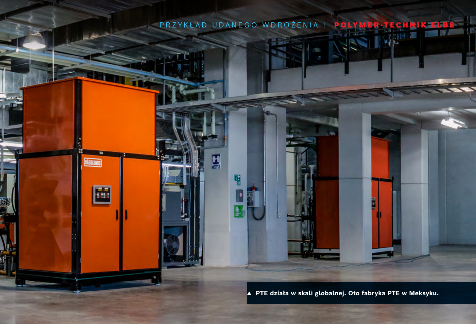
▲ PTE działa w skali globalnej. Oto fabryka PTE w Meksyku.