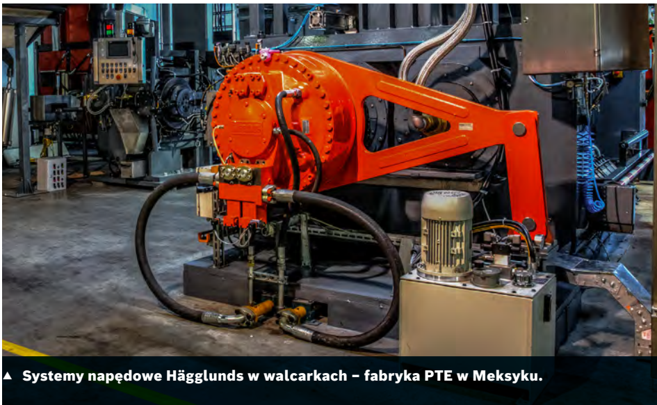
▲ Systemy napędowe Hägglunds w walcarkach – fabryka PTE w Meksyku.